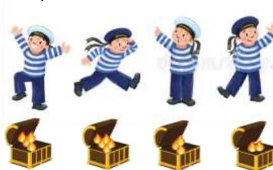
Рисунок 2. Сундуки знаний

Отрядный рейтинг может быть изображен в виде команды матросов экспедиции, у каждого из которых может быть свой "Сундук знаний". За каждый факт об исследуемом море матросу в сундук вкладывается "огонь". Таким образом к концу смены, самый просвещенный матрос в отряде может стать победителем в личном рейтинге.