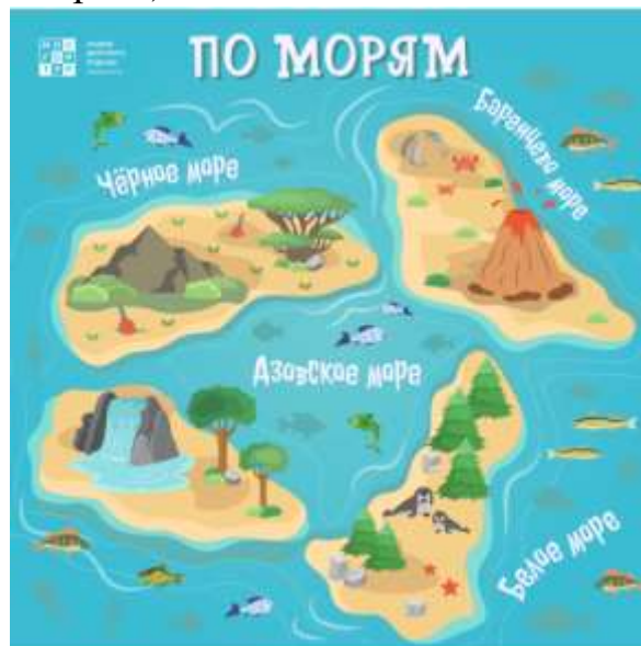
Рис. 1 Игровой баннер

На каждой нити флотилии необходимо сделать то количество узлов, которое заработала флотилия на предыдущем этапе. (Рисунок 1. Игровой баннер. "Покорители морей").